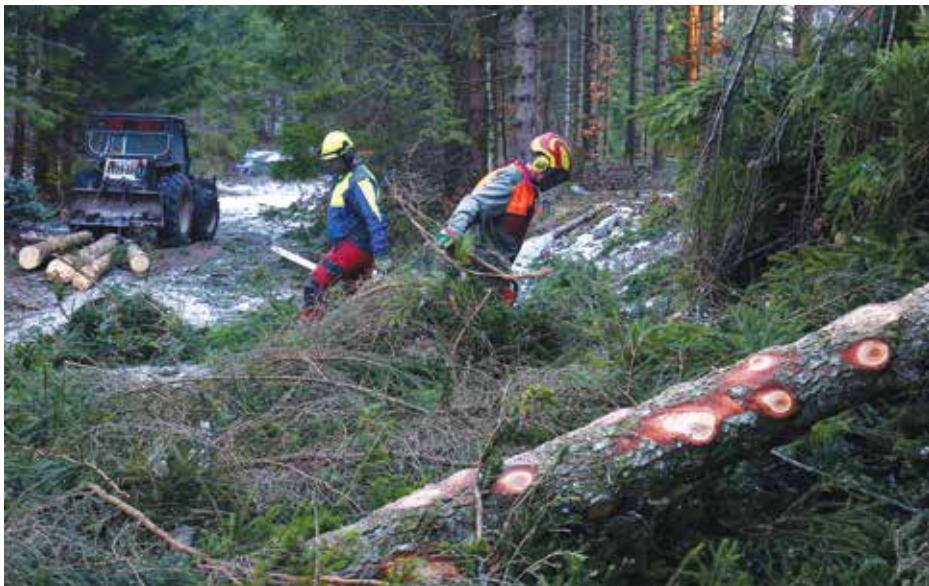
Sanacija poškodovanih gozdov je na nekaterih območjih že v polnem teku.

Bo pa popis poškodovanosti gozdov na odsek služil za izračun ocene škode, ki se bo vnesla v spletno aplikacijo AJDA, v kateri se zbirajo podatki o ocenjenih škodah na stvareh enotno za vse občine, v katerih se škoda ocenjuje. V obrazcu za oceno škode na kmetijskih površinah in gozdovih je sicer navedeno, da se bo ocena škode na tem obrazcu štela kot vloga za izplačilo sredstev za odpravo posledic naravne nesreče, če bo Vlada Republike Slovenije odločila, da se za odpravo posledic škode v kmetijstvu namenijo posebna proračunska sredstva. Vlada v tem primeru sprejme tudi poseben program za odpravo posledic škode in način koriščenja teh sredstev.