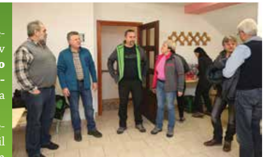
Avtorica: Cvetka Borštnik

Uradnemu delu je sledil še družabni, ki ga je letos popestril Tine Schein iz Notranjskega regijskega parka z zanimivim in poučnim predavanjem z naslovom Dediščina Cerkniškega jezera. Prijetno druženje se je nadaljevalo še pozno v noč.