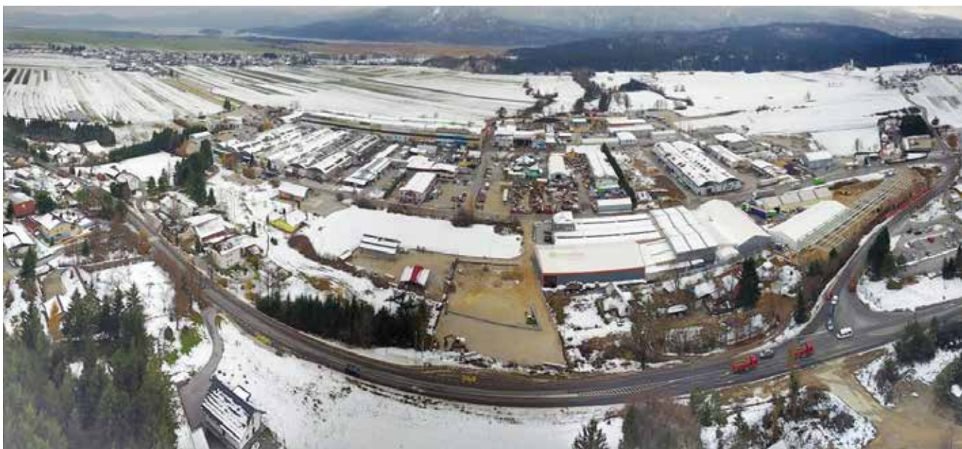
Tudi v občini Cerknica je kar nekaj uspešnih, inovativnih podjetij, ki se prijavljajo na razpise.