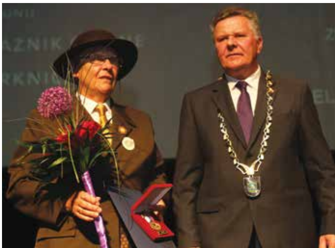
Ob občinskem prazniku so rakovski čebelarji prejeli Zlato taborsko priznanje Občine Cerknica.