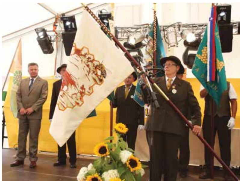
V okviru praznovanja 110-letnice delovanja je ČD Rakek razvilo prapor.

Čebelarško društvo Rakek je v okviru praznovanja 110-letnice delovanja razvilo prapor, s katerim želi utrditi delovanje društva in ohraniti bogato tradicijo čebelarstva in čebel na našem področju.