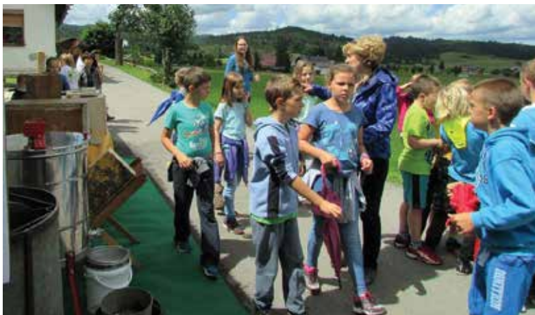
Dan odprtih vrat