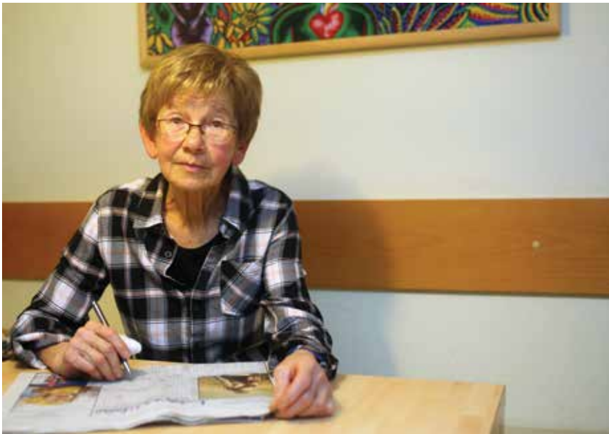
Danes jo zaposlujejo vnuki, pevski zbor, hoja, križanke ...