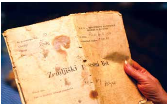
Posestni list iz leta 1947 je bil mnogokrat v uporabi.