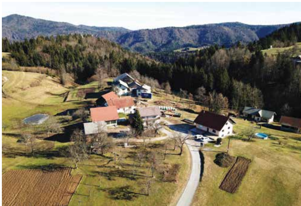
Pogled na Lešnjake