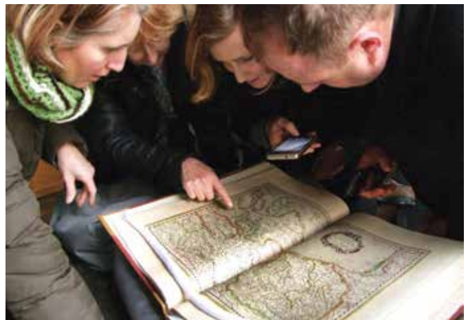
Knjiga z Valvazorjevimi zemljevidom Cerkniskega jezera v škotski podeželski knjižnici

Avtorica: Tatjana Gostiša